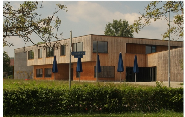
Campus Rheinfelden, gesehen ab Parkplatz Jahnstraße 1, D-79618 Rheinfelden (Baden)

Spielort Campus Rheinfelden , barrierefreier Neubau an der Jahnstraße 1 in 79618 Rheinfelden (Baden), kostenfrei parken am Campus, nahe Fußgängerzone mit Restaurants u. Einkaufsmöglichkeiten; Fußweg ab Bahnhof DB 20 Min., ab CH-SBB 25 Min.